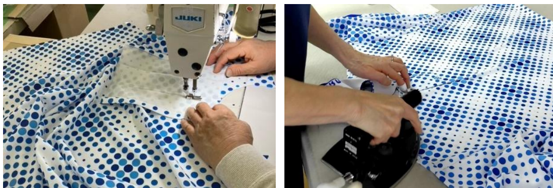
マーメイドソーイング秋田にて生地のカットから縫製、仕上げまでを担当

当社は素材メーカーとして、着心地のよい高付加価値商品の開発と提供を続けてまいります。