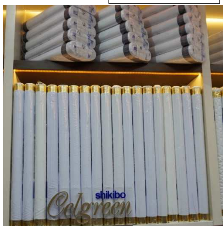
現地販売店内の様子

今回贈呈いたしました生地は、異なる種類の糸を使用し、織り方にもこだわった当社独自素材です。その特長は、型崩れがなく、シワにもなりにくく、着用者の品位が保たれる逸品です。